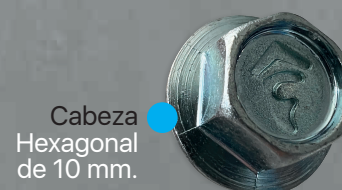
Cabeza Hexagonal de 10 mm.

*. Valores obtenidos a partir de la instrucción del acero estructural para una chapa ST37 (350 N/mm 2 )